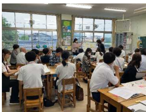
研究協議（高尾野小）