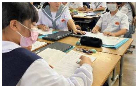
研究授業（高尾野中）