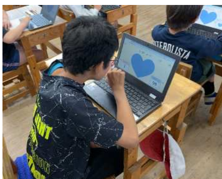
研究授業（高尾野小）