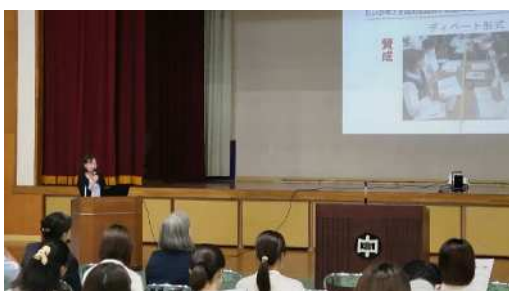
道徳教育の概要説明（高尾野中）