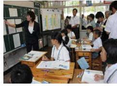
【全体での交流の様子(5・6年)】

少人数・複式学級の特性を生かした学習過程・学習形態の工夫、ガイドの育成などを通じた確かな学力の定着、発表ボードやICT機器、発表話型を効果的に活用し国語科・算数科の授業づくりを実践していました。子供たちのいきいきとした笑顔に言語活動を通じた授業実践の成果が表れています。