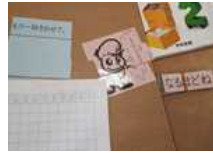
【相づちカードを使う様子】

学習の基盤となる学習のしつけに着目し、学校全体で「当たり前」のことを、当たり前続けることを大切にしています。特に、発表話型カードや相づちカードの取組は、深める過程での対話を促し、子供たちが意欲的に話し合いを行う手立てとして、とても参考になります。この取組を通して、自分の考えに自信をもち、自己肯定感が高まっています。