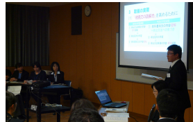
【中学校 外国語部会の成果発表】