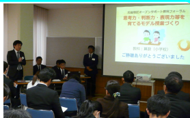
【小学校 算数部会の成果発表】