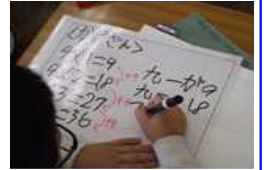
【ホワイトボードに考えを書く様子】

深める過程において、「協働的な学習の場」を意図的に設定し、前時までの学習との相違点を意識させながら考えさせ、互いの考えを練り合わせる取組は、とても参考になります。また、学校全体で算数科の環境作りに取り組み、子供たちの関心・意欲が日常的に高まっている姿を感じました。