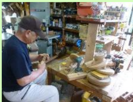
【表現を工夫する製作の様子】

令和2年・3年は新型コロナウイルス感染症の影響で中止を余儀なくされましたが、令和4年に3年ぶりに復活し、再び知覧の夏の風物詩として親しまれています。今年の演目は「かぐや姫」。平成22年に上演された時より表現を工夫した竹取物語の世界に多くの観客が魅了されました。