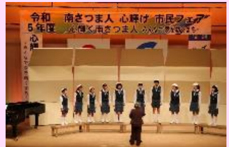
【南さつま市少年少女合唱団】