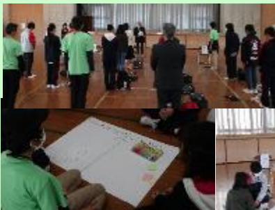
【なのはな館での活動】

今年は、鰻地区での散策や体験活動、なのはな館でのグループ活動などを通して他市の参加者との交流を深めました。この研修会での学びや気づきが、各地域での活動に生かされることを期待しています。