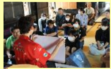
【被災者体験談講話の様子】

災害学習として「国宝 青井阿蘇神社」へ行き、被災者体験談や文化財を含む町の復興の講話をとおして災害への理解を深めました。また、人吉市のジュニア・リーダーが復興作業にボランティアとして参加している話も聴き、本市ジュニア・リーダーの活動についても考えさせられる学習となりました。