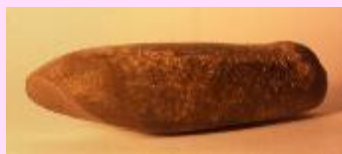
【丸ノミ形磨製石斧(梶ノ原型石斧)】