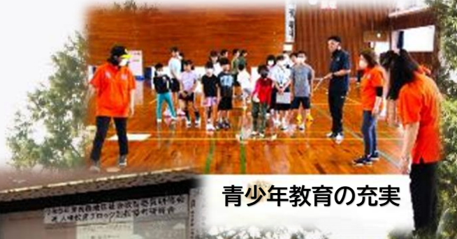
青少年教育の充実