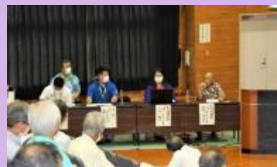
【事例発表・研究協議】