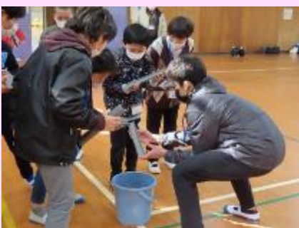
【レクリエーションの様子】

この研修をとおして、子ども会のリーダー育成及び館員の親睦を深めることができました。