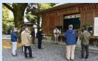
【薩摩の水からくり(豊玉姫神社)】

南九州市が進める、「市民に地元の史跡や文化財をよりよく知ってもらおう。」という取組を織り込みながらの説明は、とても興味深いものでした。文化財の存在意義、それをどのように周知し、活かしていくのかという説明は大変参考になりました。そして、文化財を前にした説明で、その内容をより実感することができ