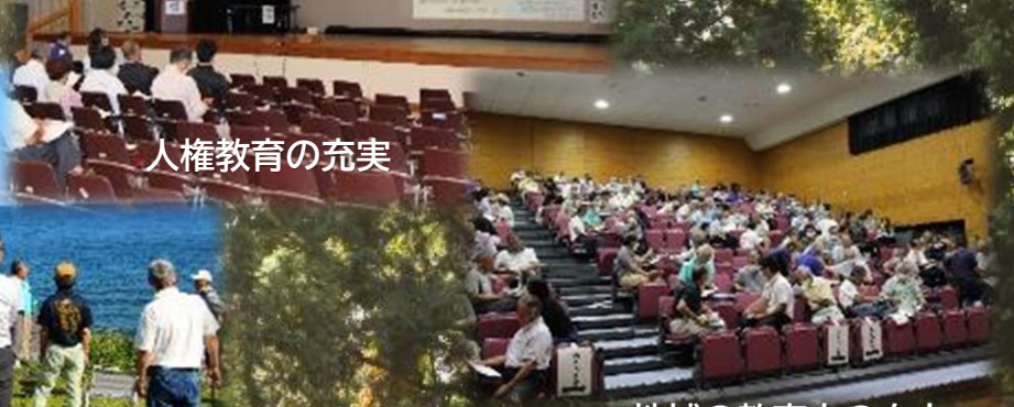
地域の教育力の向上