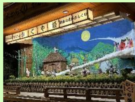
【令和5年演目「かぐや姫」】