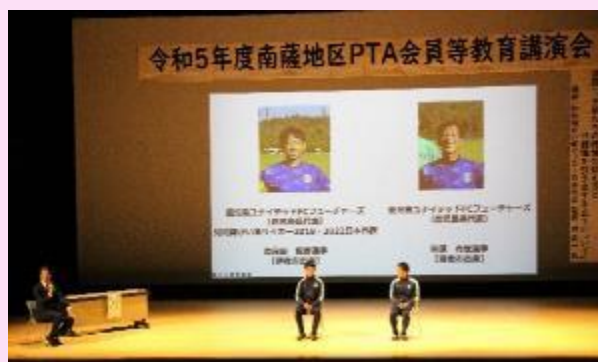
【監督・選手によるトークセッション】