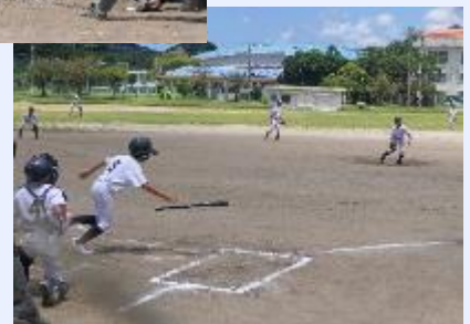
【令和5年度少年野球大会の様子】