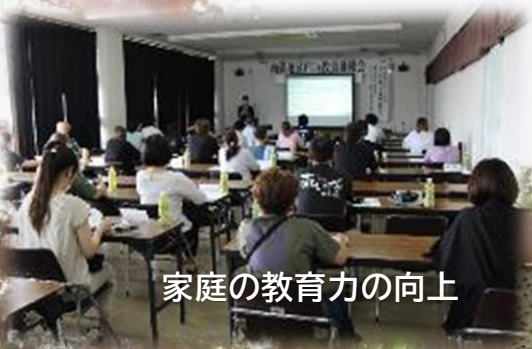
家庭の教育力の向上