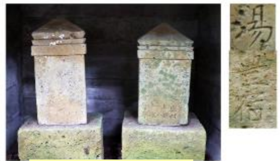
【水迫の方柱板碑(二基)】

ところが、「水迫の方柱板碑(二基)」が発見されたことで、「湯豊宿」という地名表記が、「指宿」や「掛宿」という表記と並行して江戸時代初期まで使用されていたこと、そして、統治者層だけでなく、民衆にも知られていたことが明らかになりました。「水迫の方柱板碑(二基)」は、他の3件の「湯豊宿」記銘板碑とあわせて、指宿の地名の変遷を知るうえでとても貴重な歴史資料なのです。