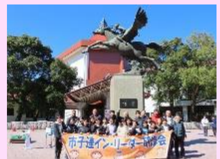
【研修会に参加された方々の記念撮影】