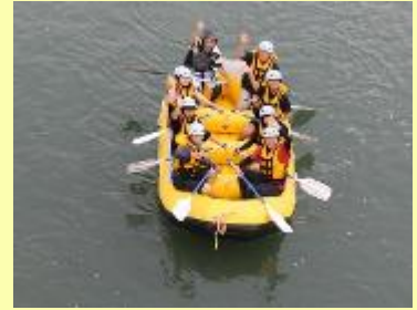
【ラフティングの様子】

日本三大急流である球磨川でラフティングをしながら、人吉市の自然を味わうとともに自然体験活動の楽しさを体感しました。ラフティングコースの中には豪雨災害により被害にあった民家や鉄道橋を間近で見ることができ、自然災害の恐ろしさも同時に学びました。