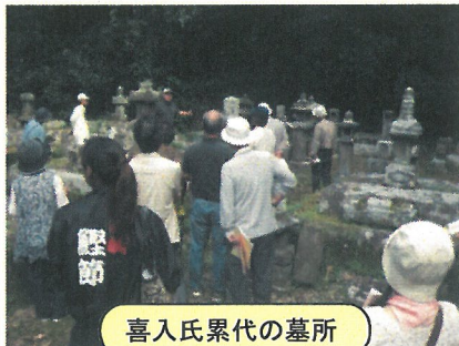
喜入氏累代の墓所

10月14日（日）に「枕崎史跡めぐり」を実施しました。枕崎市内の史跡・文化財を見聞することで、地域文化への理解を深めるための取組で、昨年6年ぶりに復活しました。昨年は12月14日の開催で大変寒かったことから、今年は気候のよい秋季に開催しました。