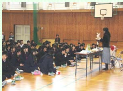
次世代向け子育て講座