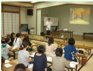
子育てサポーター研修会