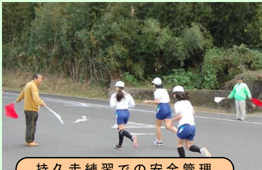
持久走練習での安全管理