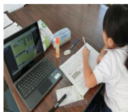
振り返りをしている様子