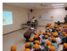
【給食センターの説明】