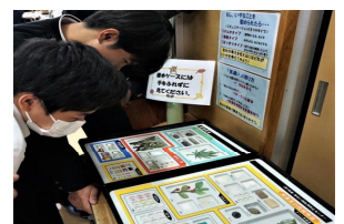
【薬物標本をみる生徒】