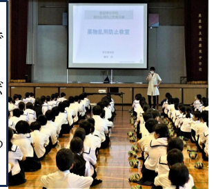
【薬物乱用防止教室の様子】