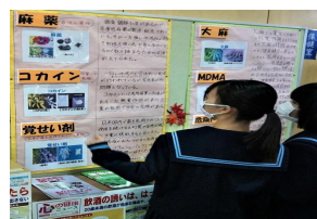
【文化祭展示の様子】

保健委員会の生徒が、文化祭において『NO DRUG KNOW DRUG!』と題し、広幅用紙に乱用薬物をまとめ、生徒や保護者へ薬物の恐ろしさを伝えた。また、薬剤師会から借用した薬物標本を見た生徒からは「絶対に手を出したらいけない」等の感想があった一方で「どんな味がするのだろう」等の声も挙がっていた。