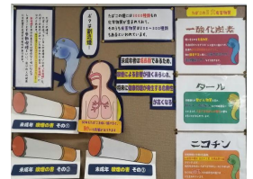
【喫煙に関する掲示】