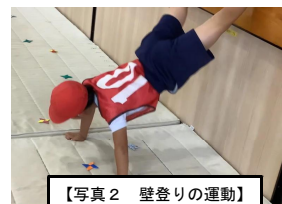
【写真2 壁登りの運動】

2年生の「マットを使った運動遊び」では、単元のめあてを「マットを使った運動遊びの動きを工夫して、にんにんランドを楽しもう」とし、様々な場を設定して取り組んだ。特に、壁登りの運動は、ステージに足をかけ横に移動することや、障害物（手裏剣）を置いて、児童の意欲を高めるなど工夫を行った。