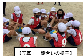
【写真1 話し合いの様子】

4年生のゴール型ゲームにおいては、ハンドボールを基にした易しいゲームを行った。はじめのルールを設定し、毎時間の授業の中でルールの工夫について話し合い、最終的にみんなが楽しくゲームに取り組むことができるルールを設定することができた。