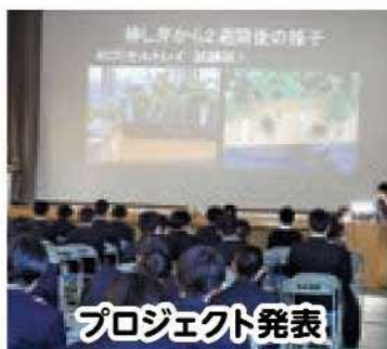
プロジェクト発表