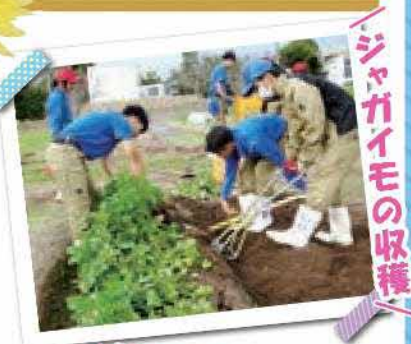
ジャガイモの収穫