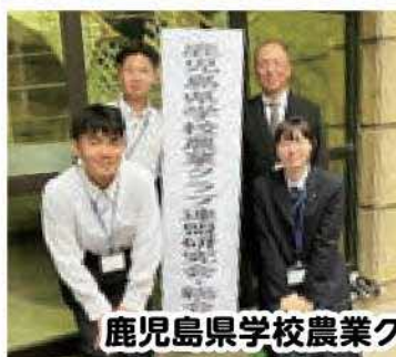
鹿児島県学校農業クラブ連盟研究会・総会