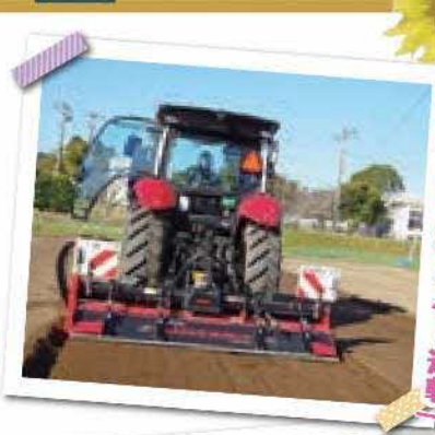
ロボットトラクター運転