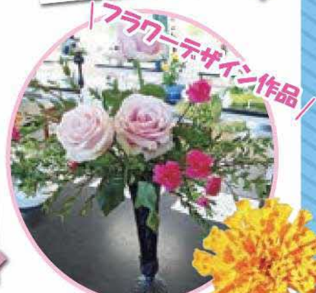
フラワーデザイン作品