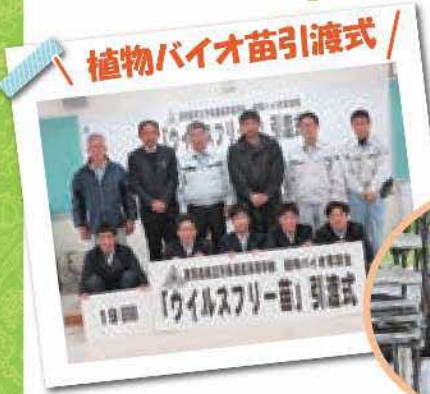
植物バイオ苗引渡式