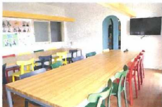
紫雲寮 ダイニング