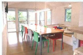
清雲寮 ダイニング