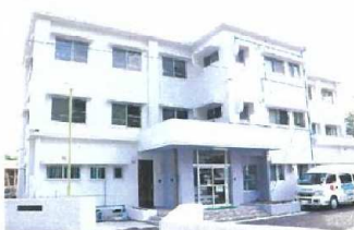
紫雲寮(男子寮) 平成31年3月完成