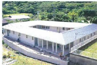
清雲寮(女子寮) 令和2年4月完成