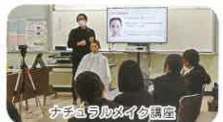
ナチュラルメイク講座