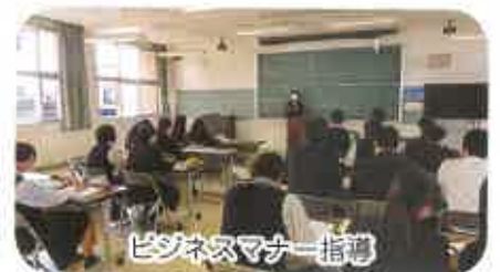
ビジネスマナー指導