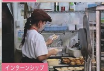
インターンシップ