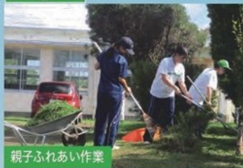
親子ふれあい作業