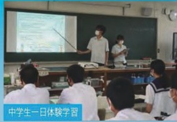
中学生一日体験学習