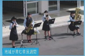
地域が育む県民週間