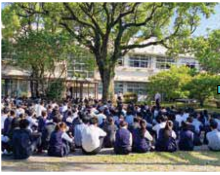
8:30 から朝礼が始まります。中庭での全校朝礼はとてもすがすがしい気持ちになります。