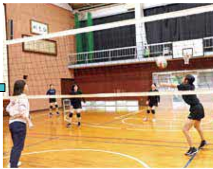
文武両道!! 放課後は部活動に打ち込む生徒が多いです。