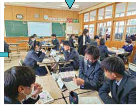
生徒同士で活発に意見を交わすことで、自分になかった考えに気づくことができ、学びが深まります!!