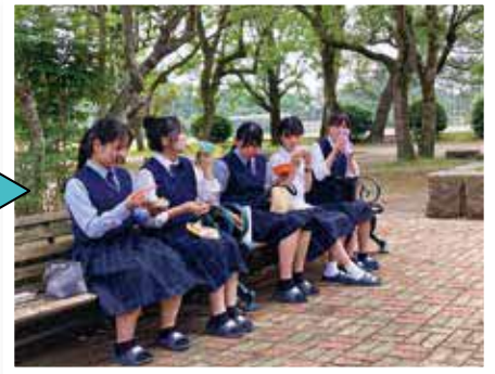
しっかり食べて午後への力を蓄えます。天気の良い日は外でお昼を食べる生徒もいます。