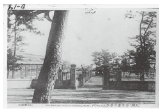
旧制志布志中学校正門

志布志高校は明治42年に県下6番目の県立中学校として開校しました。現在まで2万人を超える卒業生を輩出し、各界で活躍しています。校内には旧制志布志中学校時代のどっしりとした石造りの門柱が残り、歴史の重みを感じさせます。また、老松や楠の大木が茂り、学びの場として申し分ない自然環境を誇っています。