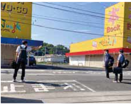
部活動をしている生徒は、18:30 頃から19:00 までに下校します。また明日も頑張ろう!!