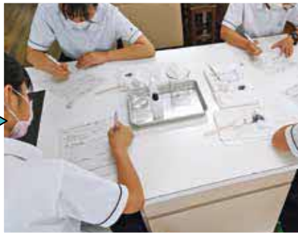
実験・実習を行う授業もたくさんあり、とても楽しいです！