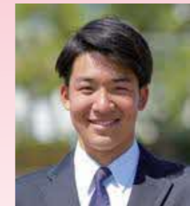
3年小牧來竜 (帖佐中出身)

進学校の行事と聞いて皆さんはどのような印象を持ちますか? 学校の規則に縛られて楽しきれなさそう! そう考える人が多いはずですが、しかしそれは大きな間違いです。毎日の勉強や部活動に明け暮れた加治木高校生にとって、行事はかけがえのない青き青春の1ページなのです。特に「龍門祭」。私も二年では応援団長を務め夏休みから仲間と汗と涙を流しました。加治木高校生は行事への熱が強く、光輝く目で「アオハル」をつくっていますよ!