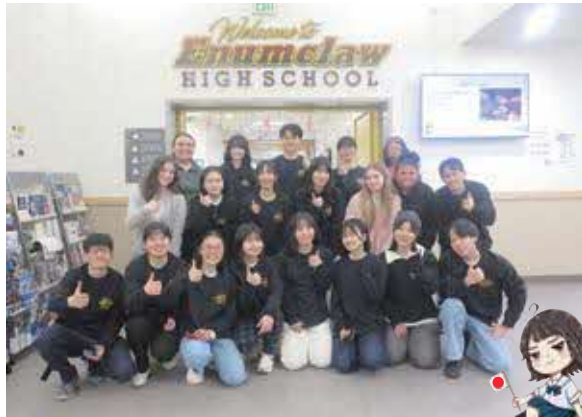
令和5年度海外短期研修 Enumclaw高校にて

環境・エネルギー・人権といった現代のあらゆる問題を克服するには、人類が一個の惑星を共有する地球人としての視座を獲得することが必要です。その素地を育むための事業です。