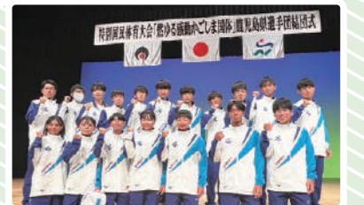
ホッケー部男子・女子