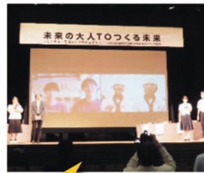
未来の大人TOつくる未来 鹿児島ブロック大会

コンソーシアム SHOKO (商工) とは、産学官で連携し、高校が核となり地域協働で将来を担う人材を育成する事業です。