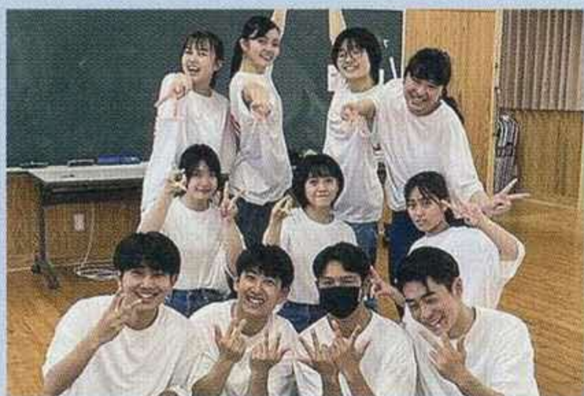
ダンスプロジェクト