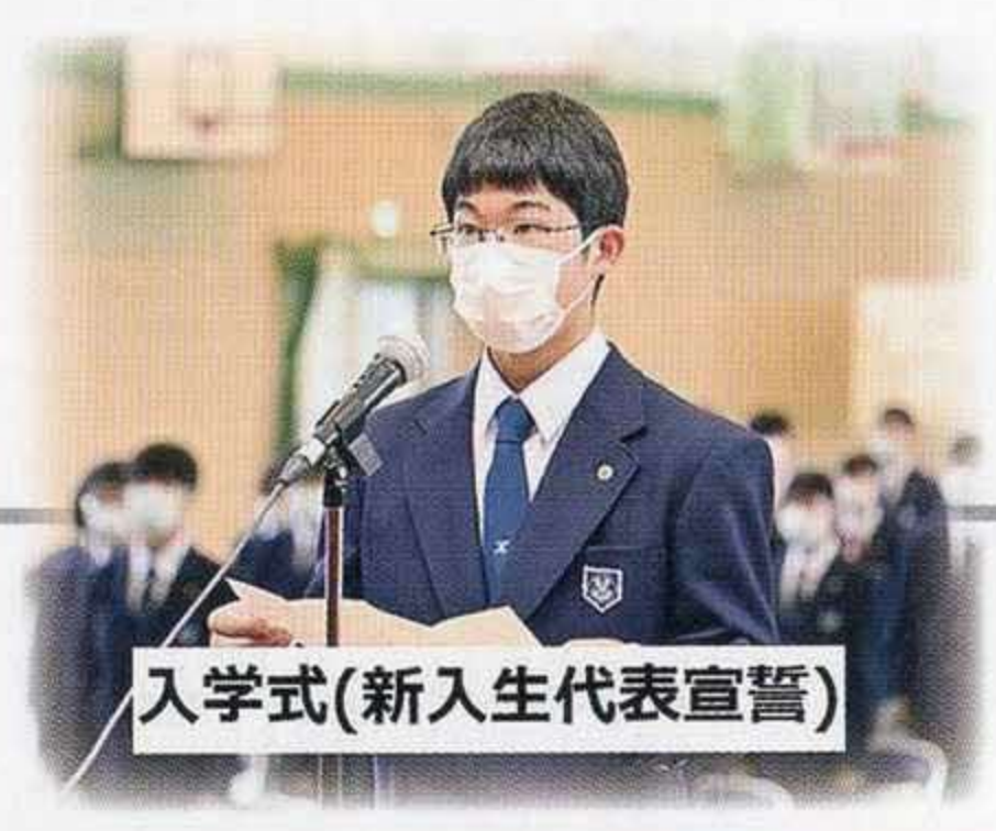
入学式(新入生代表宣誓)