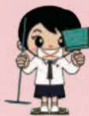
無言作業 Mugon sagyou