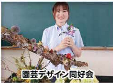
園芸デザイン同好会