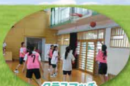
クリスマスマッチ