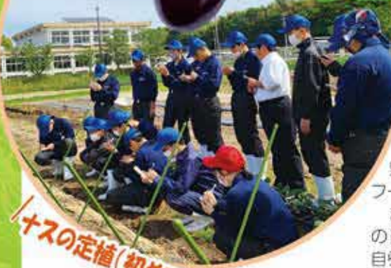
ナスの定植(初めての実習)