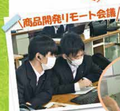
商品開発リモート会議!