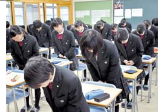
授業の開始・終了時の丁寧なあいさつ