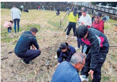
八重山棚田イルミネーション設置作業