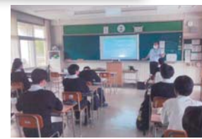
課題研究最終発表