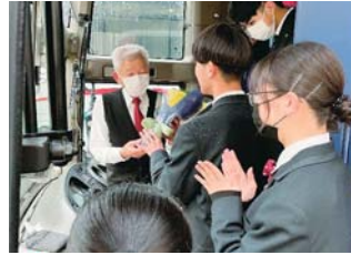
生徒によるバス運転手へのお礼のセレモニー