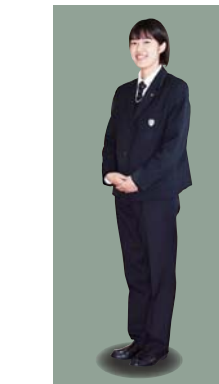
現代の多様性に配慮し、本校では女子のスラックス着用が可能です。