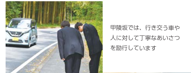
甲陵坂では、行き交う車や人に対して丁寧なあいさつを励行しています