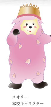
メロリー 本校キャラクター