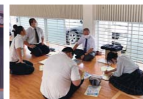
高大連携模擬授業

商業に関する基礎・基本を学びながら、資格取得を含めた幅広い進路の実現を目指し、創造性豊かな人材を育成します。