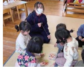
保育所での交流活動