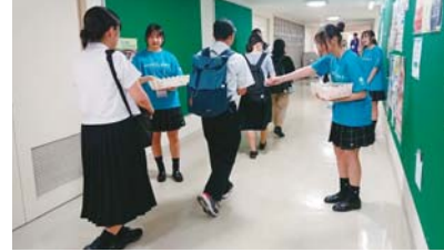
総合文化祭でのボランティア