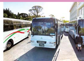
下校時の校内ロータリーの様子