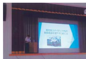
課題研究校内研修