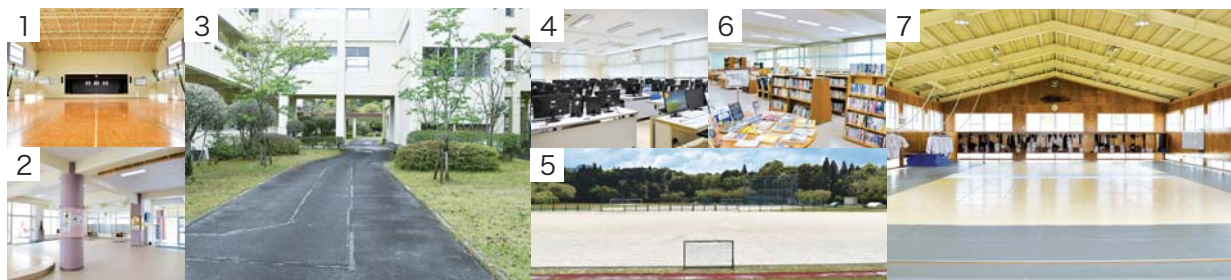
1 体育館 2 多目的ホール (各階) 3 中庭アプローチ 4 パソコン室 (4カ所) 5 グラウンド 6 図書室 7 柔道場