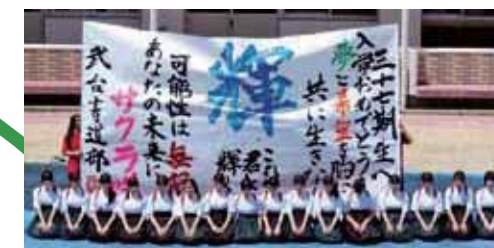
新入生歓迎 書道部パフォーマンス