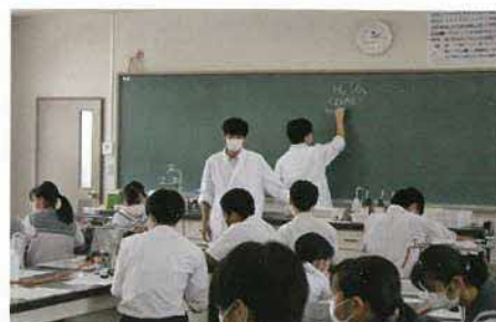
オープンスクール