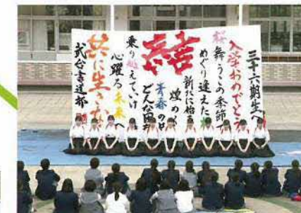
書道部パフォーマンス