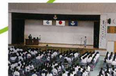
5月 創立記念講演会