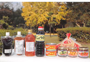
大人気の加工品! 他にはパンやベーコンも。ドローン飛行実習とプログラミング学習