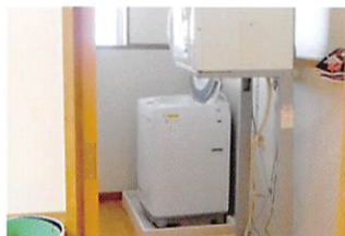
洗濯機・乾燥機完備！