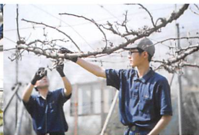
果樹(梨やブドウなどの栽培)