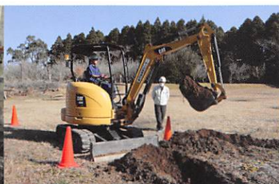
小型車両系建設機械の講習