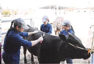
最高ランクA5-12の牛を出荷(R4年度)