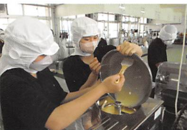
アイスクリーム・マシンを導入