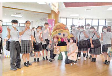
地域交流(ふくしまルシェ)