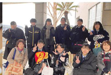
介護福祉士国家試験場にて