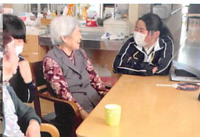
施設での校外実習