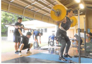
ウエイトリフティング部