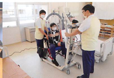
最新設備を用いた校内実習