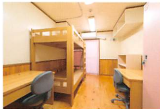
冷暖房完備(各居室)・Wi-Fi(食堂)