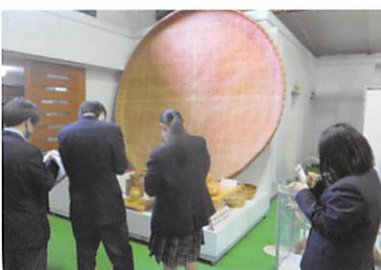
総合的な探究の時間「ちくりん学」(2年生(左)と1年生(右)の様子)