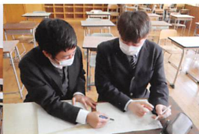
進路志望に応じた個別指導