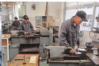
機械加工実習(旋盤)