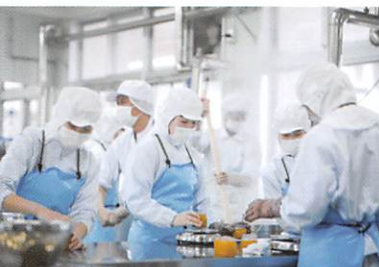
食品製造(キンカンマーマレード)

講義はもちろん校内実習や施設実習など、福祉を専門的・実践的に学びます。国家資格である介護福祉士国家資格は全国平均以上の高い合格率を誇ります。