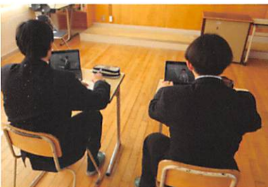
スタディサブリの活用