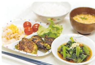
手作り美味しい食事は大好評！