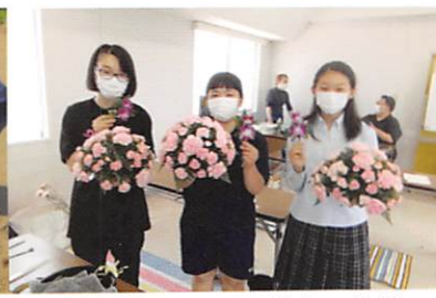
フラワー装飾技能検定に挑戦