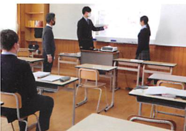
充実した少人数指導

総探や総合選択制の授業など幅広い学習を実施。2年次より文系・理系に分かれ、きめ細やかな学習指導を通して進路実現を目指します。