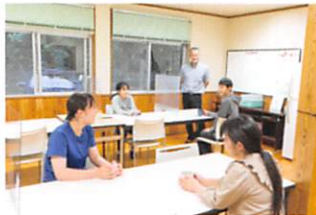
学校のすぐそば。安心・安全！