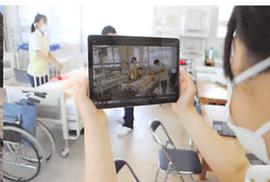
介護技術を競うコンテストに出場