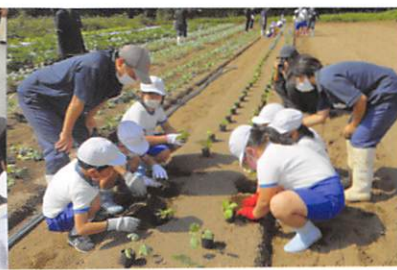
地域交流(ふれあい農園)