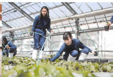
野菜(露地栽培や施設栽培)