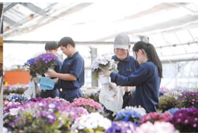
草花(鉢花や花苗などを栽培)