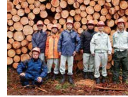
▲ 現地研修（木材市場）