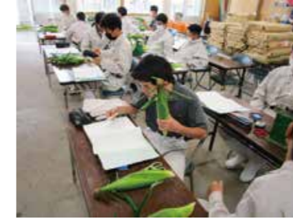
▲スイートコーンの収量調査