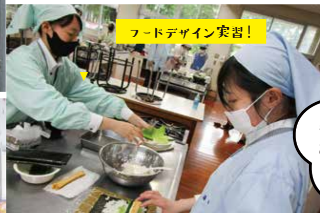
フードデザイン実習！