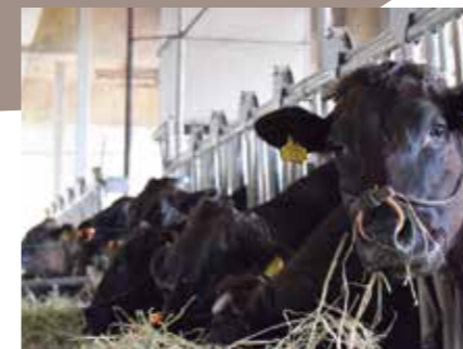
▲肉用牛の一般管理

肉用牛専攻では、肉用牛の出産・子牛育成・繁殖管理・肥育管理までを一貫して学習します。現在、牛舎には黒毛和種という品種が40頭います。また、水田での稲作と飼料作物の栽培を実践で学びます。