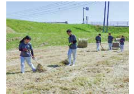
▲水田と飼料作物づくり