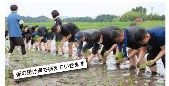
係の掛け声で植えていきます

全校生徒職員で植えたこの田んぼのお米は、12月に行われる「収穫祭」で試食します。