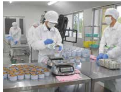
▲ 更生之素計量・缶詰め作業