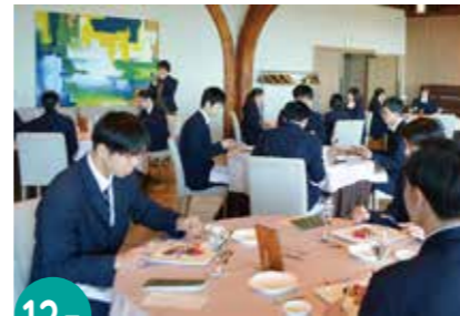
12月 テーブルマナー講習