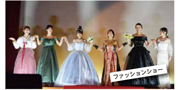
ファッションショー