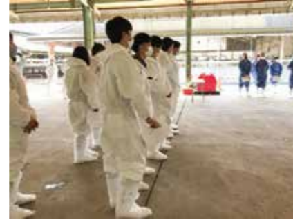
▲ オークション会場