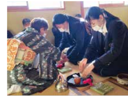
▲ 生活文化 (茶道)