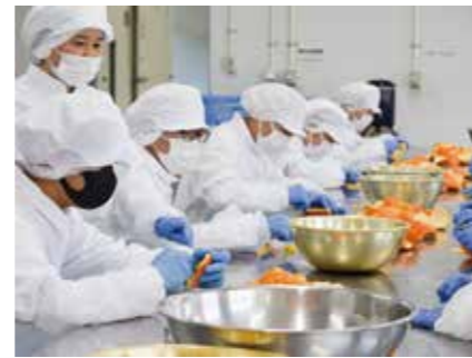
▲ マーマレード作り