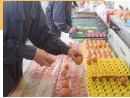
▲ 鶏卵の出荷・調整・パック詰め

養豚専攻では、黒豚と産卵鶏（卵を産むために育てる鶏）の飼育を学んでいます。また、お客様に届くまでの流通の学習や商品開発にもチャレンジ。鹿児島黒豚の元になるお父さん、お母さん豚も育てています。鹿児島のおいしい黒豚の生産に携わっているという誇りを持って実習しています。