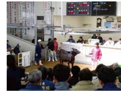
▲家畜市場での子牛出荷