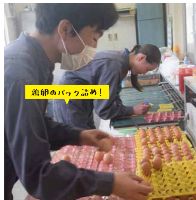
鶏卵のパック詰め！