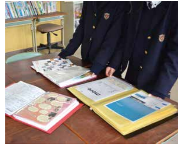
▲資料室にはたくさんのパンフレットが