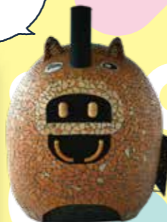
(100周年記念事業で設置)