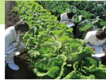
▲ハクサイの生育調査

園芸専攻では、主に「花」と「野菜」の栽培について学習します。種をまき、花が咲いて実ができる「収穫の喜び」を学べる専攻です。