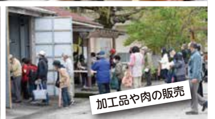
加工品や肉の販売