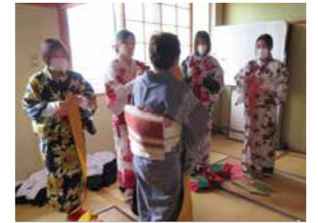
▲ 生活文化 (着つけ)