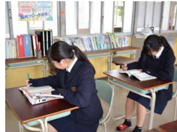
▲自習室もあります