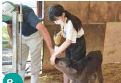
8月 中学生体験入学