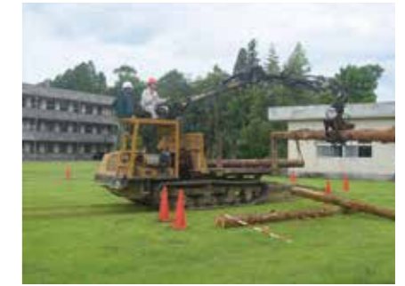
▲ フォワード運転技能講習