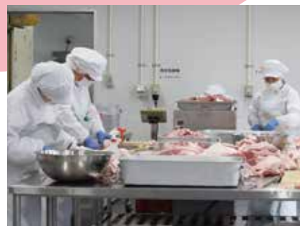
▲ 更生之素製造/肉カット

食品加工専攻では、食品の安全と製造方法について学びます。新しい加工品の開発にも挑戦しています。みそ加工品の「更生之素」はテレビ取材もあり、全国的に有名になりました！