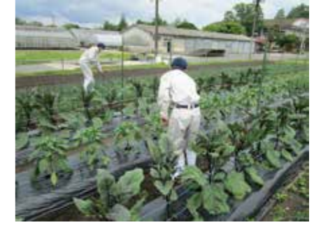
▲露地野菜の管理作業