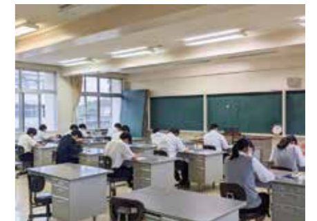
▲ ビジネスコミュニケーション