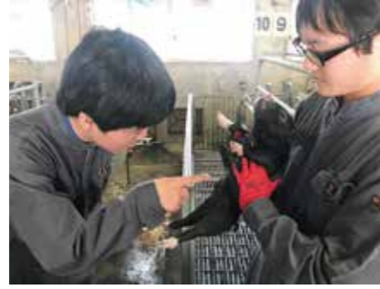
▲ 子豚の個体チェック