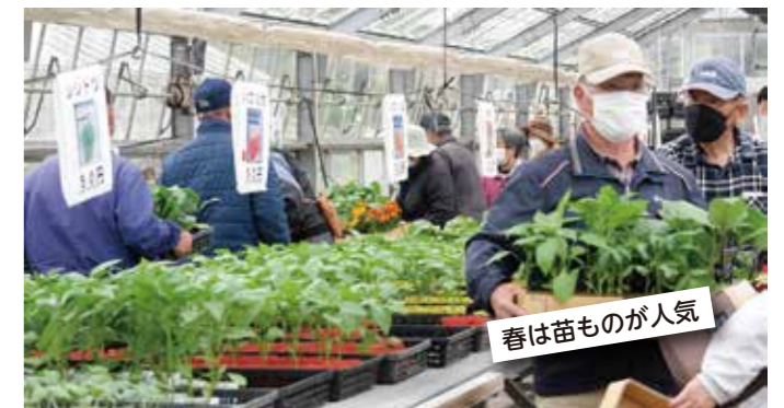
春は苗ものが人気

毎回多くの来場者が伊佐市内はもとより県内全域から伊佐農林高校農林技術科の逸品を求めていらっしゃいます。