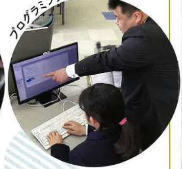
プログラミング (情報会計)

商業の各分野における学びのニーズに合わせて、個人やグループで主体的・協働的に探究します。