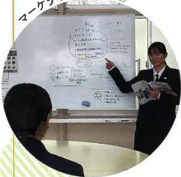
マーケティング (商業)

お客様のニーズに合わせた商品・サービスの開発や販売戦略、広告などについて学びます。