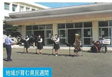
地域が育む県民週間