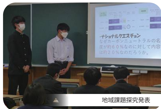
地域課題探究発表