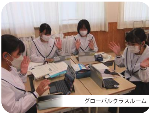
グローバルクラスルーム