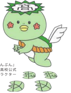
『ぶんぶん』 川内高校公式 キャラクター