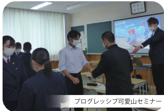
プログレッシブ可愛山セミナー