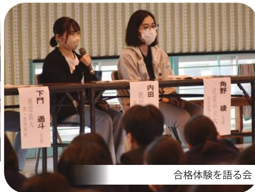
合格体験を語る会