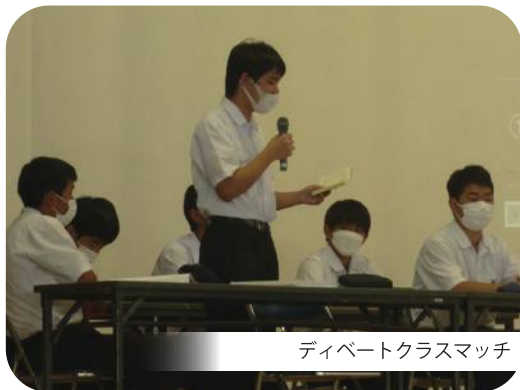
ディベートクラスマッチ