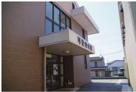
▲可愛山会館（1階は食堂・2階は合宿所等）