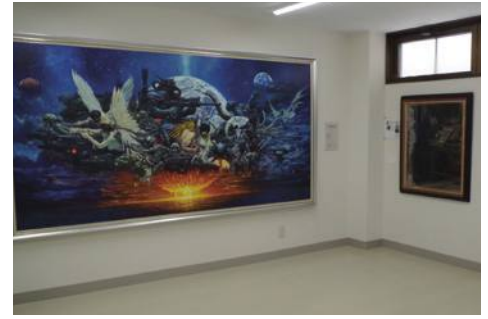
▲可愛山ギャラリー（可愛山会館2階）