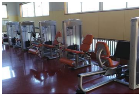
▲トレーニングセンター