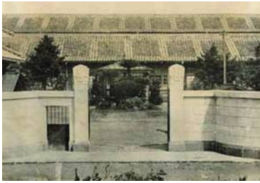
鹿児島県立川内高等女学校 (旧制川内高等女学校)