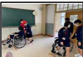
実習体験(看護福祉部会)