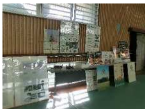
学校紹介・実習作品展示