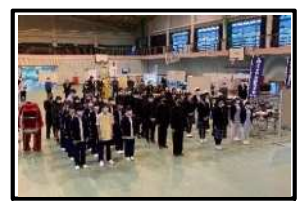
全体会場のようす (開会式)