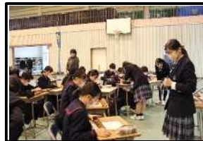
そろばん体験(商業)