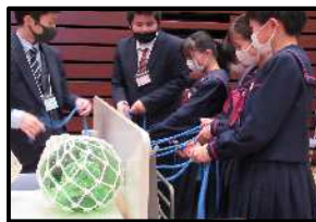
ロープワーク体験(水産)