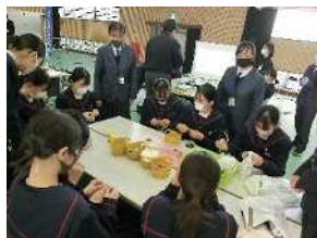
ピンクッション作り(家庭)