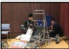
ゼロハンカー展示(工業)