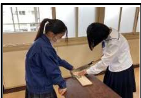
ウォールシェルフ(工業部会)