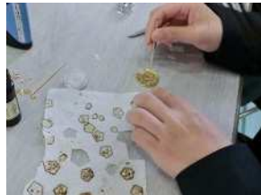
オクラストラップ作成体験(農業)