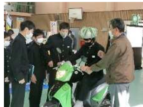
電動バイク実車体験(工業)