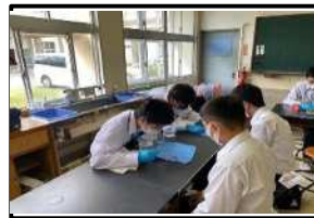
キーホルダーづくり(農業部会)