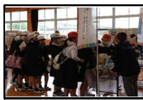
全国総文祭紹介ブース