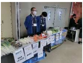
実習生産物販売(農業)