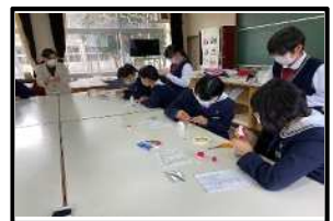
キャップピンクッション(家庭部会)