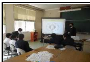
会社クイズ(商業部会)