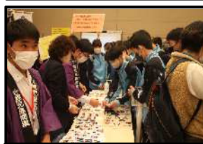
缶バッチ作成(商業)