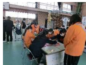
テーブルクレーション紹介(福祉)