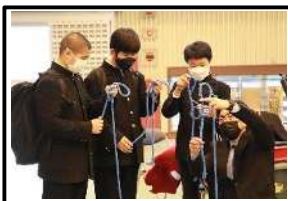
ロープワーク体験(水産)