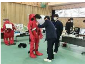
イマーシブスーツ着脱体験(水産)