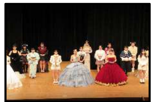
被服作品発表(家庭)