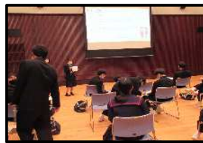
農業クイズに挑戦(農業)