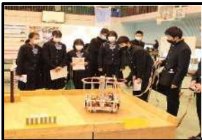
ロボット操作体験(工業)