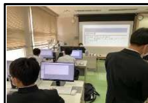
プログラミング(商業部会)