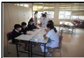
実習体験(看護福祉部会)