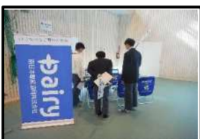
地元企業展示体験ブース