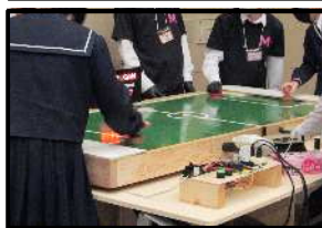
エアホッケー(工業)