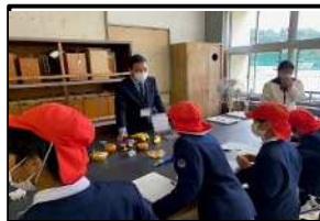
野菜果物精度測定(農業部会)