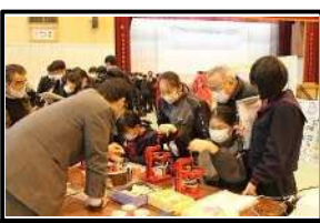
缶詰製造体験 (水産)