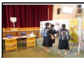
企業展示体験ブース