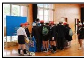
仕事紹介 (九州電気保安協会)