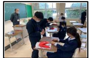
電子工作(工業部会)