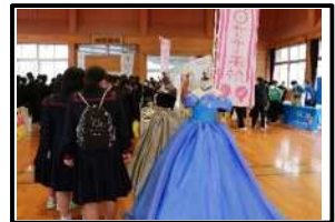
制作作品展示(家庭)