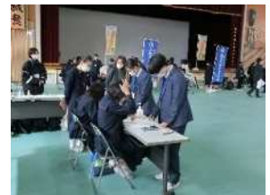
電卓操作体験(商業)