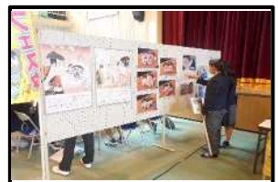
地元企業展示ブース