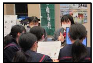
ホームページ作成(商業)