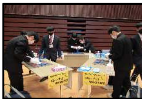
ホルト・ナットの締め付け体験(水産)