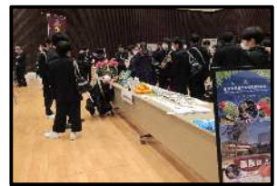
学校紹介・鉢花展示(農業)