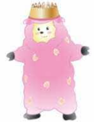
本校イメージキャラクター「メオリー」