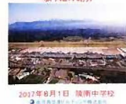
鹿児島空港ビルディング(株)の 取り組み紹介

2017年8月1日 陵南中学校 鹿児島県霧島市霧島1-1-1 霧島空港ビルディング