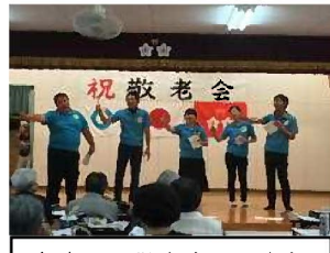
各字での敬老会への参加