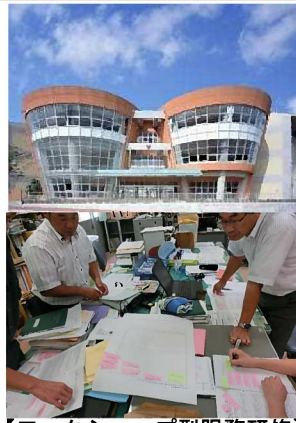
【ワークショップ型服務研修】