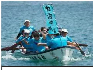
港祭舟こぎ競争への参加