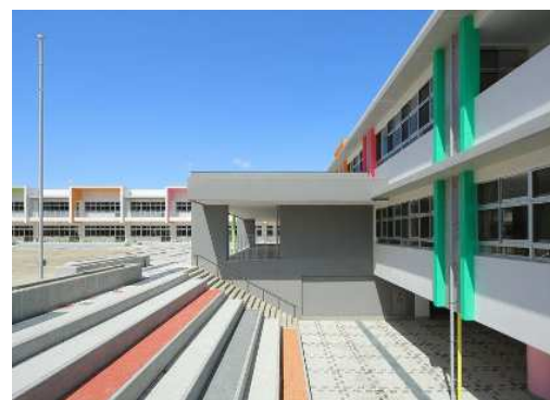
ピロティ 上段グラウンドからピロティ