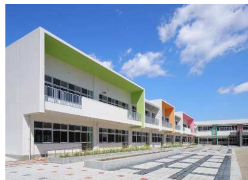
普通教室は全て南向きだが、直射日光を避ける庇・ベランダ設置