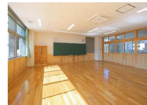
教室 腰壁・家具等に木材を使用