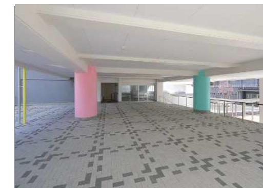
ピロティ 雨天でも活動できる空間