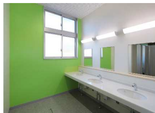
トイレ手洗い トイレ手洗いは全て自動水栓

： バリアフリー化を図り、また家具等に木材を使用することで、木の温かみを感じる空間とした。高校跡地への移転改築であるため、敷地の高低差を利用して上段校舎・ふれあい広場と下段体育館・グラウンドをつなぐピロティを設け、児童の安全な移動経路、屋外活動の場、休憩場所を確保した。