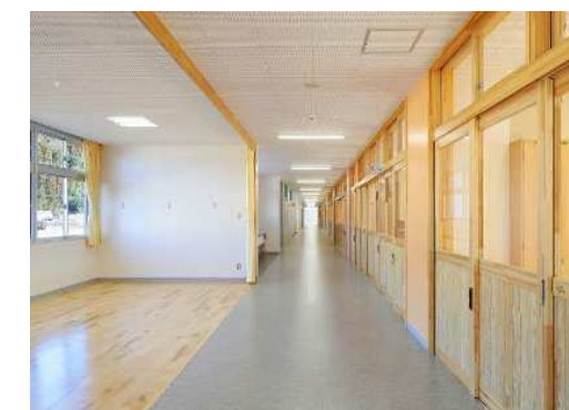
多目的スペース 廊下・多目的スペースを一体的に活用