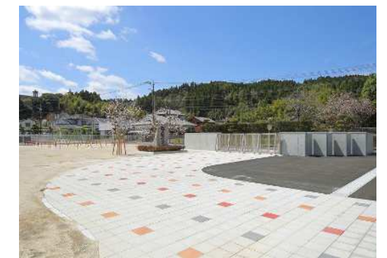
正門(児童登下校用門) 別に副門を設け、歩車分離を図った