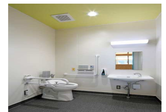
多目的トイレ 建物全体をバリアフリー化