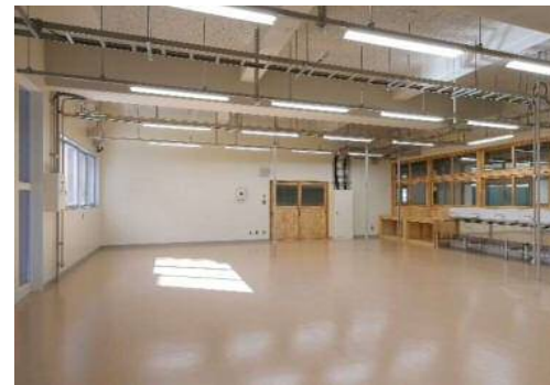
配線・配管を見て学べる 1階木造実習室※