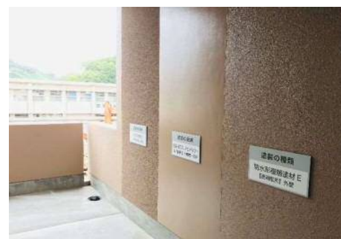
塗装の種類を見て学べる 塗り分けられた外壁