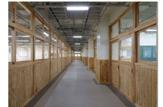
配線・配管を見て学べる 1階廊下※