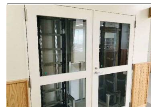
内部構造を見て学べる 分電盤