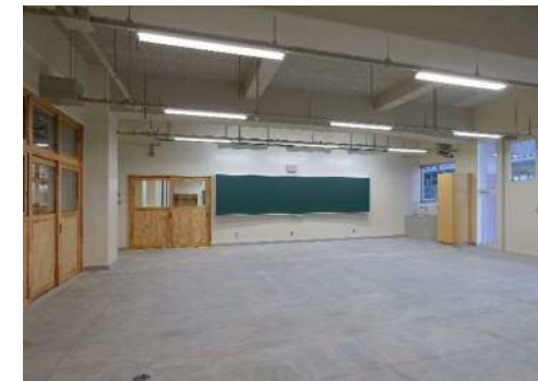
配線・配管を見て学べる 1階材料構造実習室※