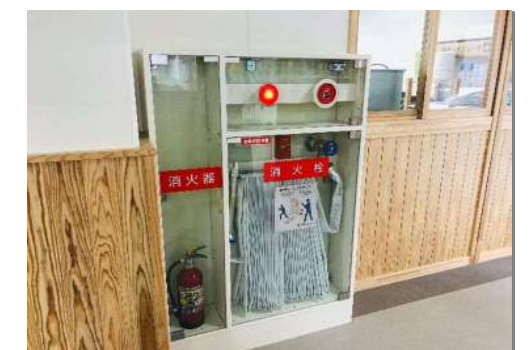
内部構造を見て学べる 屋内消火栓