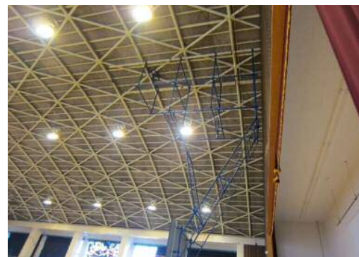
着工前写真 (ステージ側)