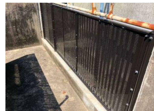
ブロック塀等改修 (プール内ブロック塀の一部を 目隠しフェンスに改修)