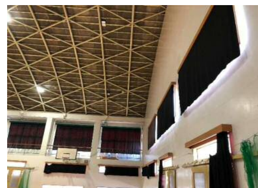
完成写真 (壁面吊下式バスケットゴールの撤去 照明器具をLED器具に改修)