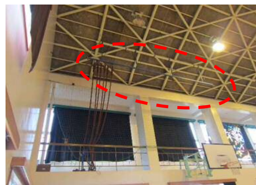
体育器具の耐震対策 (天井吊下式昇りロープの撤去)

実施年度 : 平成30年度 延床面積 : 屋内運動場:870㎡(RC造1階)、武道場:300㎡(S造1階) 特徴など : 屋内運動場:吊下式及び壁面吊下式バスケットゴールの撤去、吊下式昇りロープの撤去、照明器具をLED器具に改修 武道場:照明器具の振れ止め補強 ブロック塀等:既存塀撤去のうえフェンスに改修