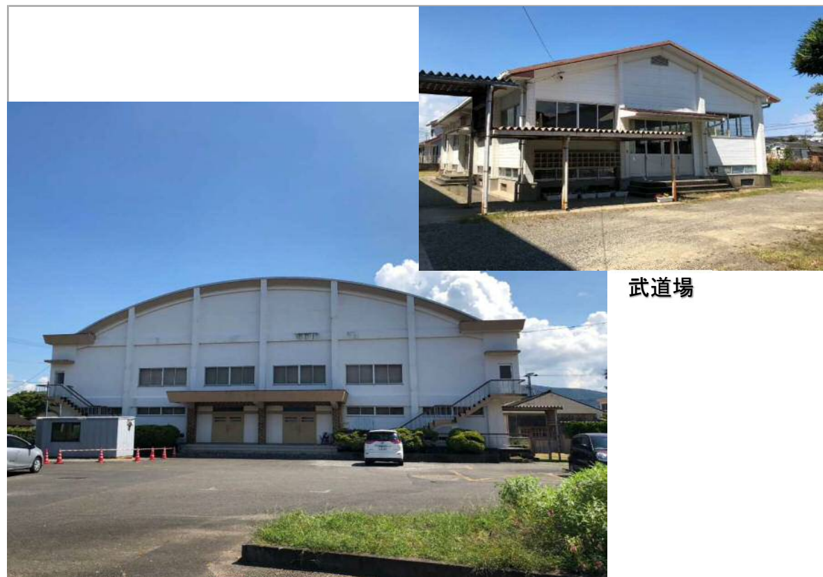
屋内運動場 全景写真