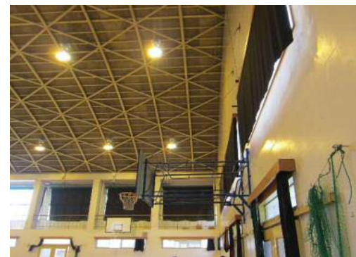
着工前写真 (正面玄関側)