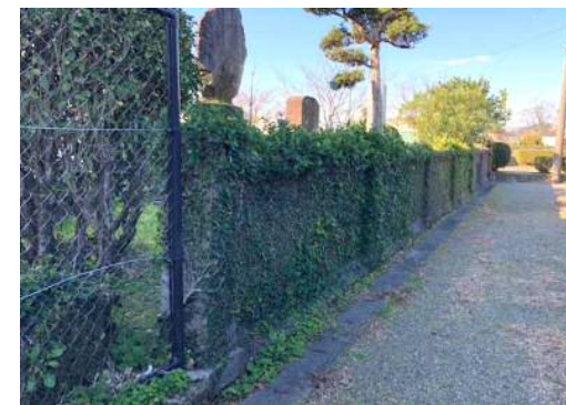
着工前写真 (石造塀)