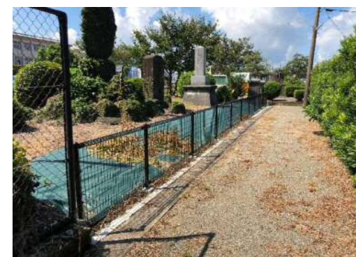
完成写真 (メッシュフェンスに改修)