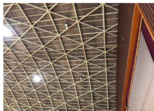
完成写真 (吊下式バスケットゴールの撤去 照明器具をLED器具に改修)