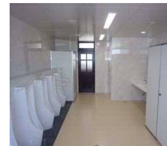
広々とした乾式のトイレ