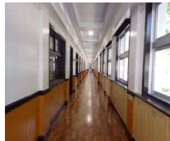
木のぬくもりのある廊下