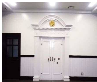
歴史を感じる校長室