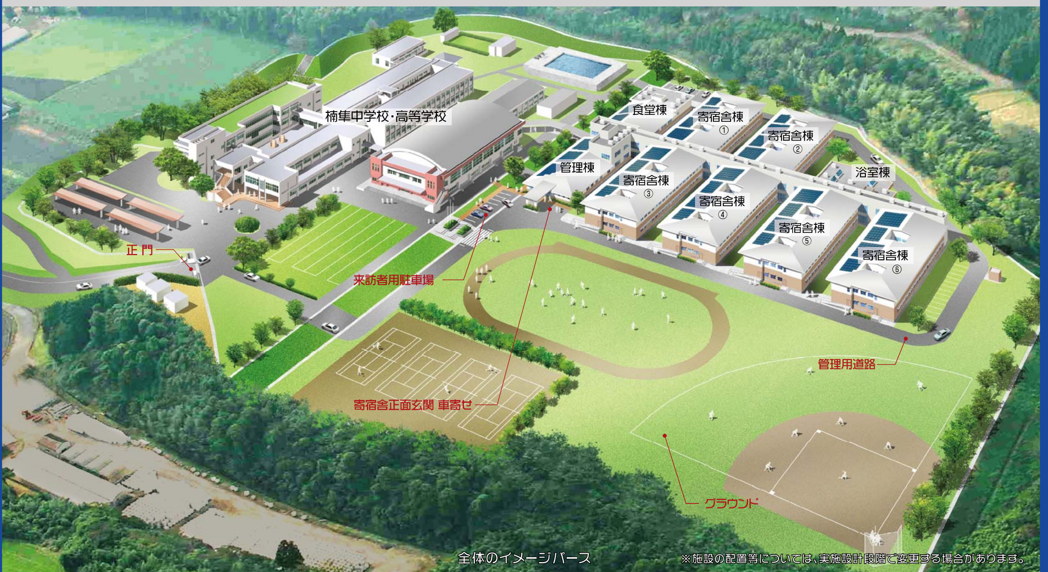
全体のイメージパース