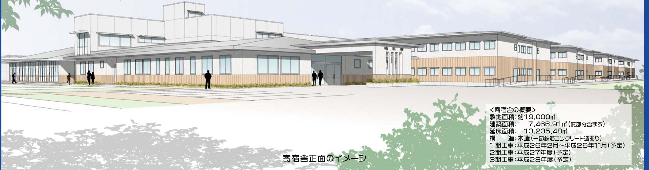
寄宿舎正面のイメージ

現在、大隅地域の高山高校敷地で、寄宿舎の新設や校舎改修などの整備を進めています。