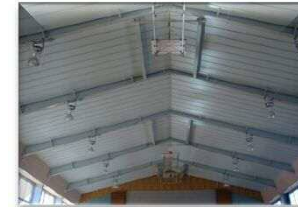
アリーナ 天井撤去完了