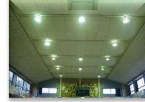
改修前のアリーナ天井