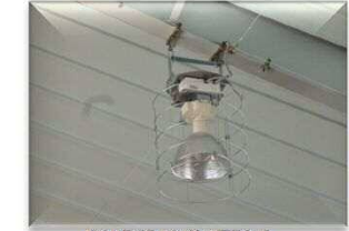
照明器具落下防止 ステンレスワイヤー