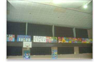
改修前のアリーナ内部