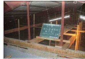
ステージ壁 頭つなぎ補強