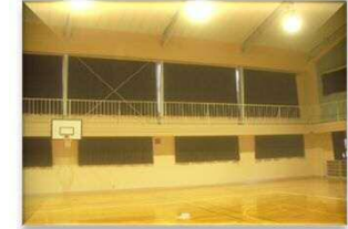
アリーナ内部改修完了