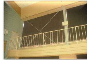
耐震フレース 8構面