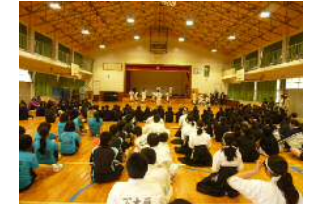
改修後の体育館にて 新入生の部活動紹介