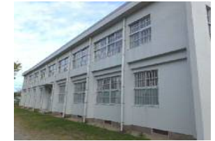
改修後の外壁（南面）