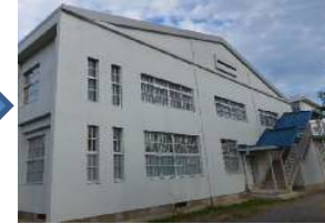
改修後の外壁（東面）