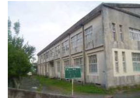
改修前の外壁（東・南面）