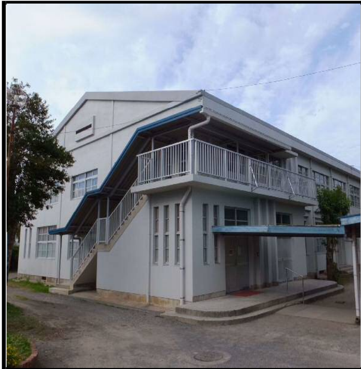
全景写真（学校正門側）