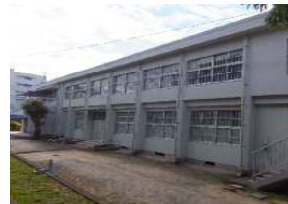
改修後の外壁（北面）