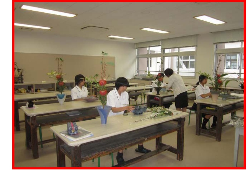
家庭総合実習室（華道）