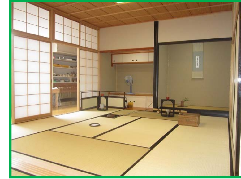
家庭総合実習室（茶道）