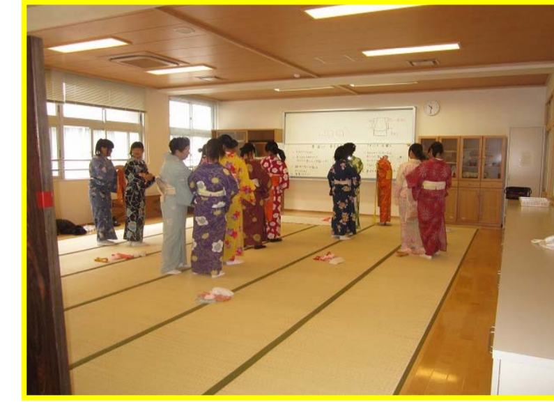
家庭総合実習室（着付）