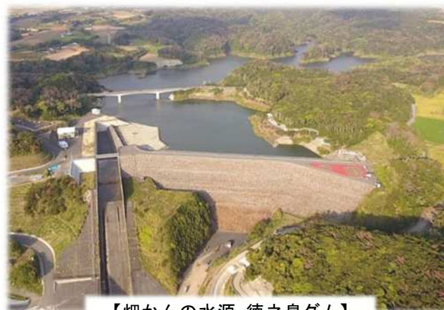
【畑かんの水源：徳之島ダム】