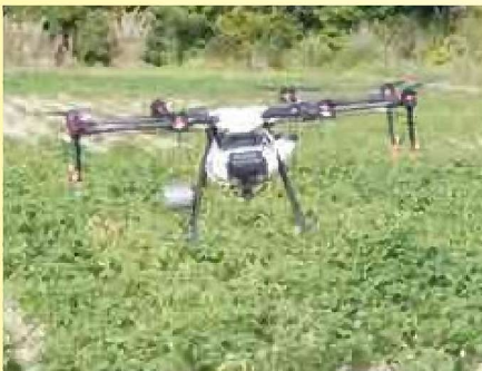
農薬散布中のドローン