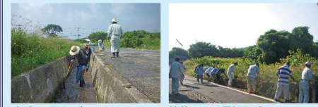
水路の泥上げ 補栽による景観形成