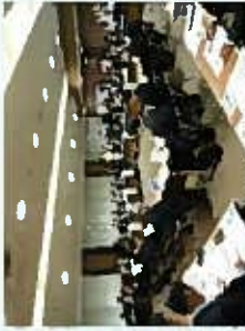
協議会の開催状況

平成29年度までに、既に設置されているが、水防災意識社会構築に向けた「水防意識社会」の再構築を目的として、水防法に基づき協議会を設置し、今後の取組内容を記載した「地域の取組方針」をとりまとめ