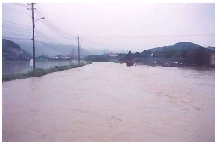
平成2年7月洪水 佐志川