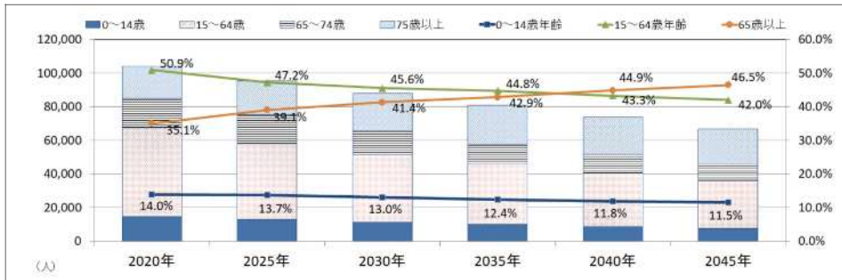
図1：奄美地域の人口推移予測と全国・県・奄美地域における人口減少率の推移（※）