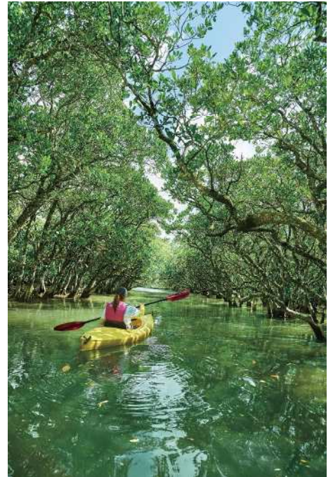
マングローブ原生林