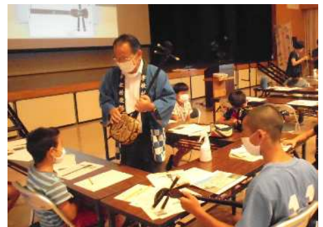
島口・島唄の教育活動