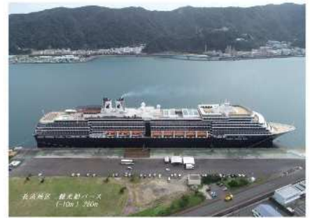
名瀬港観光船バース