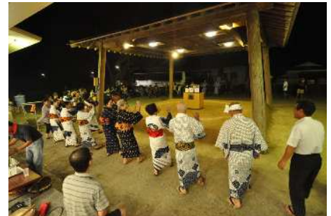
大和村大棚 八月踊り