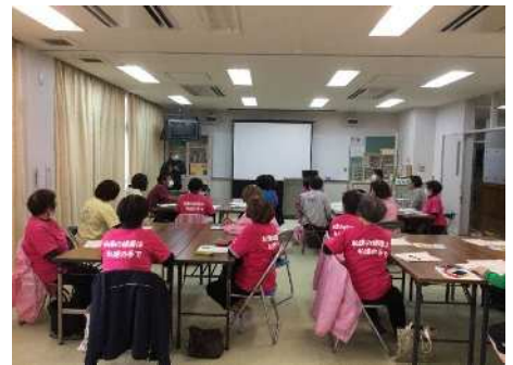
地域・職域・学域が連携した健康づくり