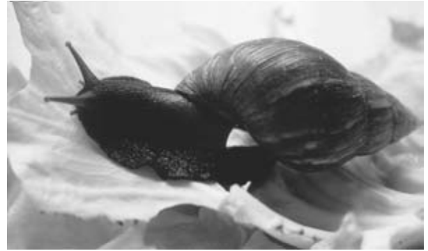
(カ) アフリカマイマイ