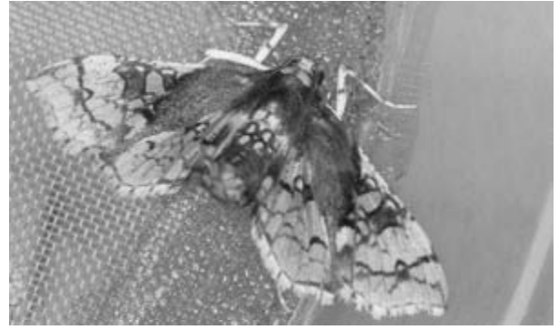
(オ) サツマイモノメイガ