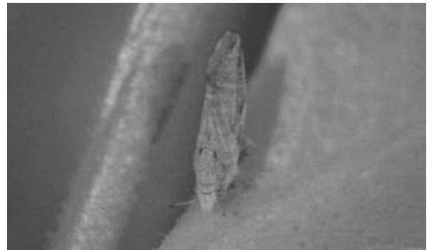
(キ) ミカンキジラミ (カンキツグリーンング病媒介虫)