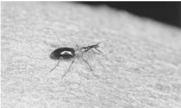
(ウ) アリモドキゾウムシ