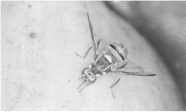
(ア) ミカンコミバエ