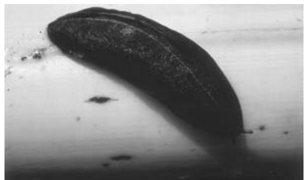
(ク) アシヒダナメクジ