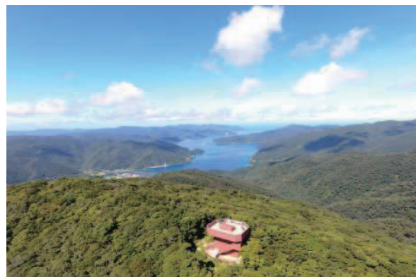
湯湾岳公園・展望台リニューアル (宇検村: 令和3年4月)