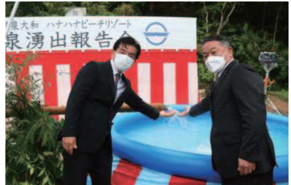
大和ハナハナビーチリゾート 温泉湧出報告会 (大和村:令和3年11月)