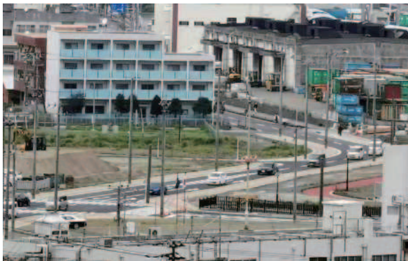
奄美市名瀬の臨港道路が全線開通 (奄美市: 令和3年3月)