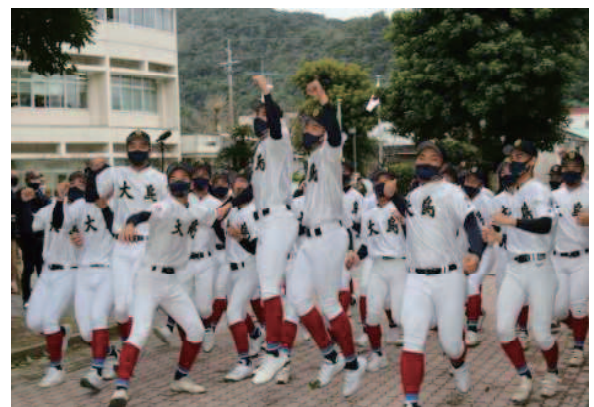
大島高校 選抜高校野球大会出場決定 (奄美市:令和4年1月)