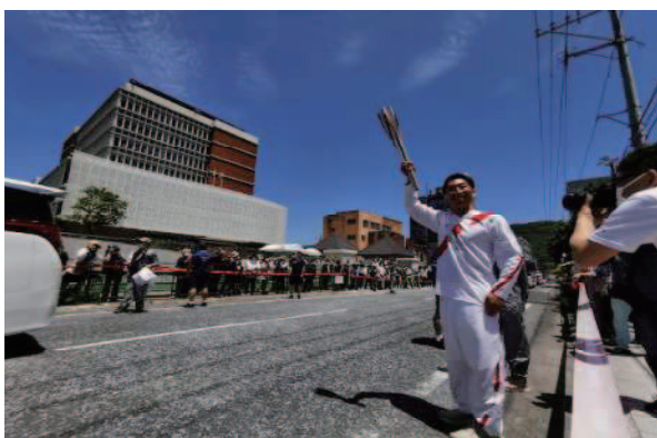
東京オリンピック聖火リレー (奄美市: 令和3年4月)