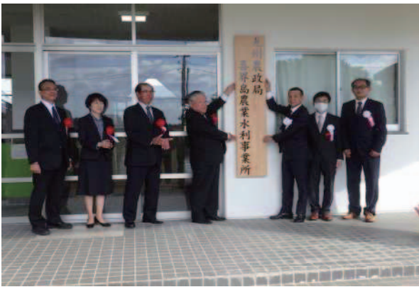
九州農政局 喜界島農業水利事業所開所式 (喜界町:令和3年11月)