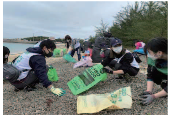
奄美群島各地に軽石漂着 (奄美群島全域:令和3年11月～)