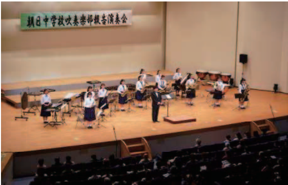
朝日中学校 全日本吹奏楽コンクール銀賞 (奄美市:令和3年10月)