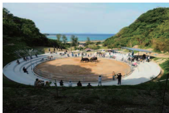
花徳闘牛場再整備 完成記念式典 (徳之島町: 令和3年5月)