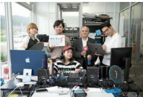
コミュニティーラジオ局「せとうちラジオ放送」開局 (瀬戸内町:令和4年1月)