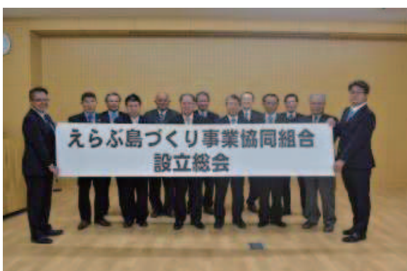
特定地域づくり事業協同組合として県内初認定 (沖永良部2町: 令和3年5月)