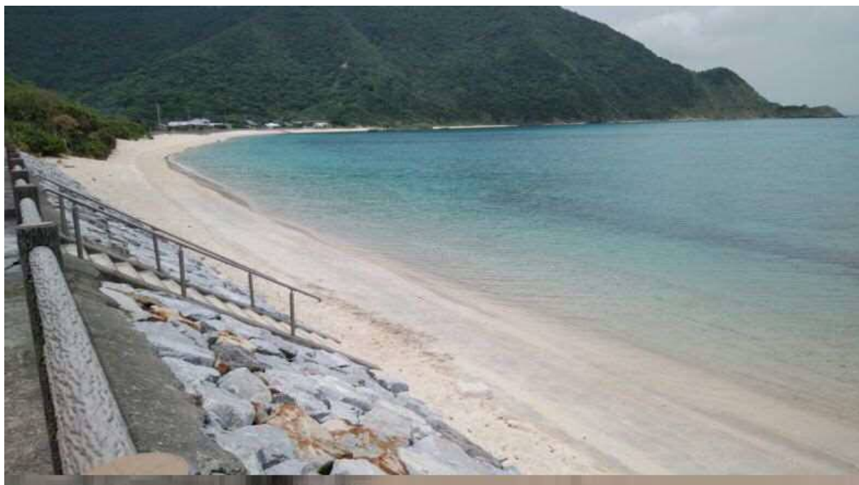
屋鈍(やどん)海水浴場

焼内湾は、美しい珊瑚礁の宝庫。屋鈍海水浴場は奄美を代表する海水浴場です。水中には、色鮮やかな熱帯魚が群をなして泳いでいます。ゴーグル片手に海中散歩をいかがですか。トイレ・シャワー・駐車場も完備しています。