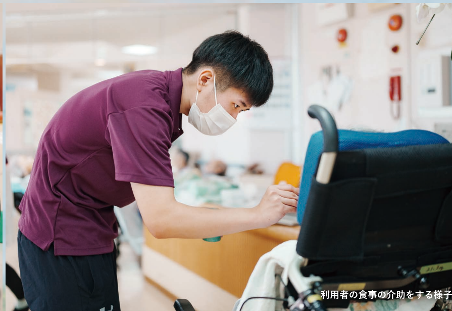
利用者の食事の介助をする様子