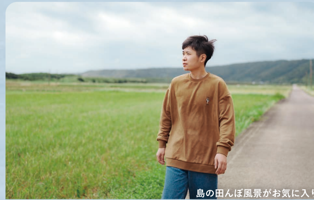
島の田んぼ風景がお気に入り