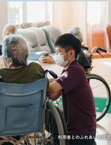
利用者とのふれあいの時間

目指したいなと思っているのは、デイサービスと一緒に働いていた先輩です。すごく面白くて周りの人を笑わせるのに一生懸命な方で、利用者様の楽しいという気持ちを一番に考える、そんな働き方を尊敬しています。自分も苑の皆さんを楽しませることが出来る職員になれたらいいなと思っています。