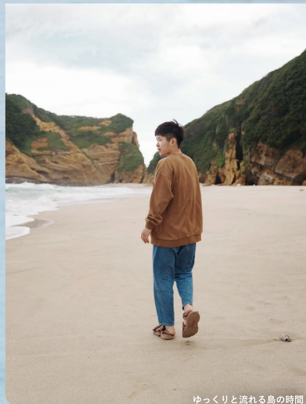
ゆっくりと流れる島の時間