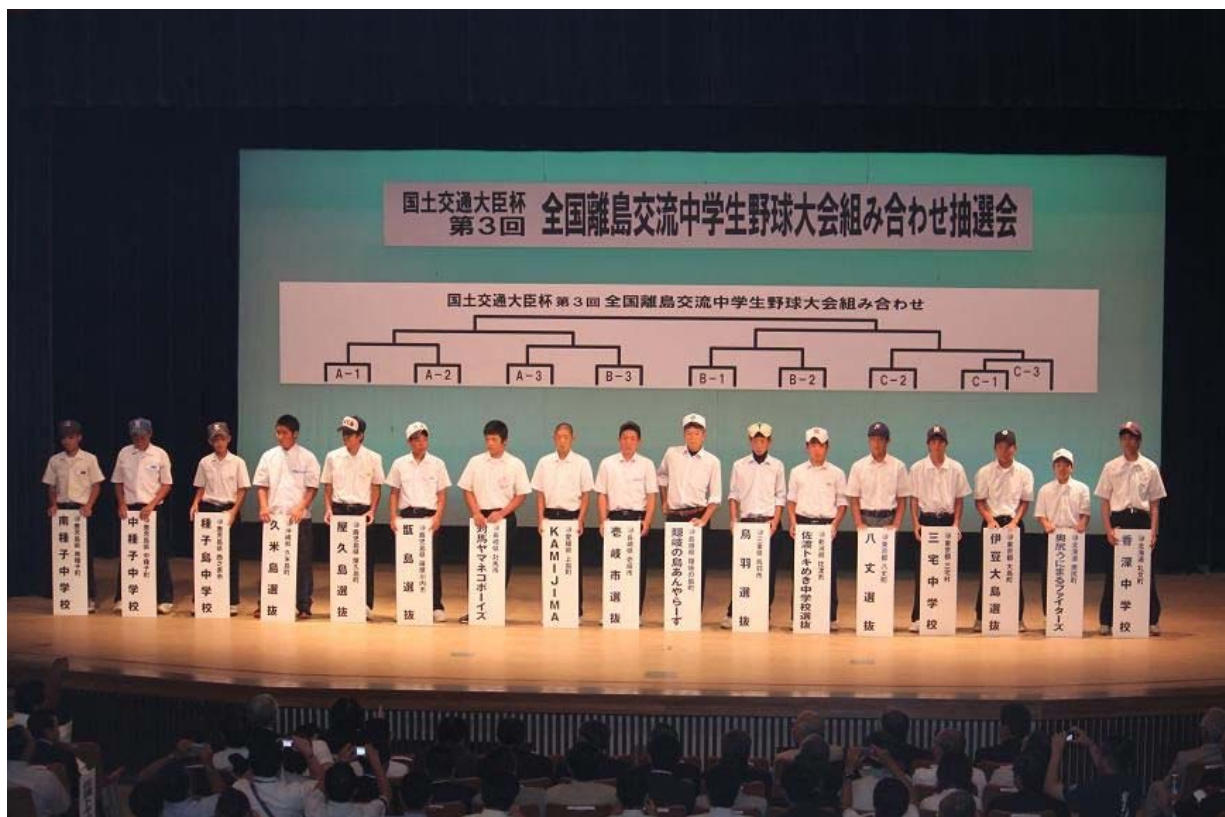
国土交通大臣杯 第3回全国離島交流中学生野球大会 (平成22年8月18日～21日)